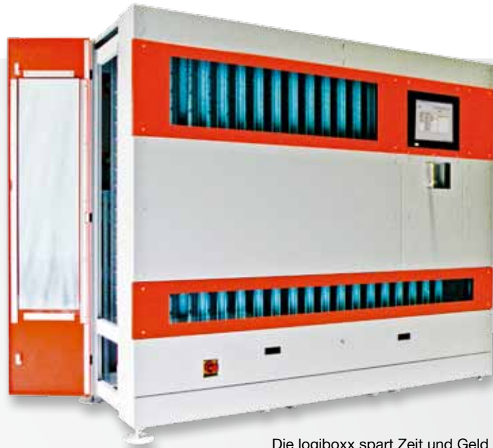
Die logiboxx spart Zeit und Geld bei der Werkzeugverwaltung. www.logiboxx.at

unten rechts Robotergreifer für die Automobilindustrie